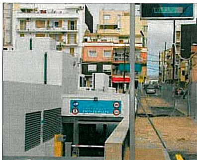
Entrada a l'aparcament soterrat municipal de l'Ametlla.

Els botiguers interessats poden adquirir aquests talonaris a l'Ajuntament al preu de 2,5 euros cadascun (que és el cost de la impressió) i posteriorment repartir els tiquets entre els clients